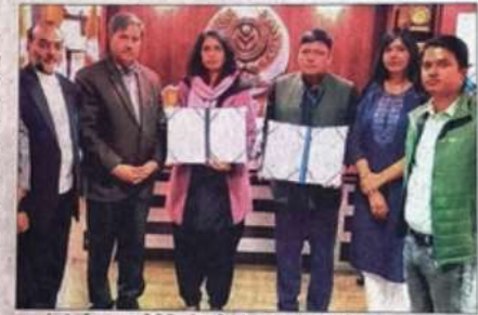
अनुबंध के दौरान सुभारती विवि और शहीद मंगल पांडे कॉलेज के शिक्षकगण। मेरठ।

दरअसल, शासकीय एवं गैर शासकीय संस्थानों के मध्य एम.ओ.यू.