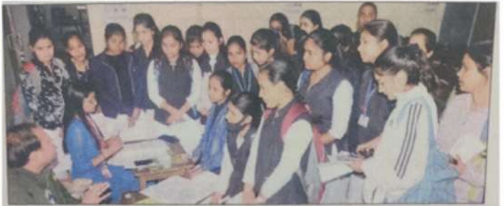
शहीद मंगल पांडे पीजी कॉलेज में आयोजित मेले में जानकारी लेती छात्राएं।