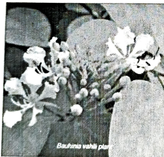
Bauhinia vahlii plant

sisal, kenaf etc. are obtained with almost no pesticides during their production and less chemicals during their processing. These fibres are present in abundance all over India, but still neglected everywhere. Apart from abundant