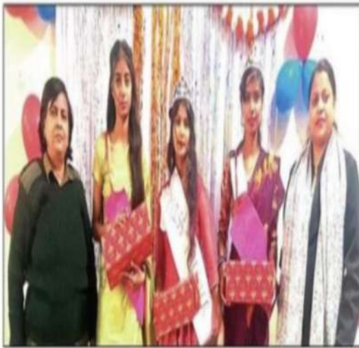
शहीद मंगल पांडे राजकीय महिला महाविद्यालय में आयोजित फ्रेशर पार्टी में मौजूद छात्राएं।