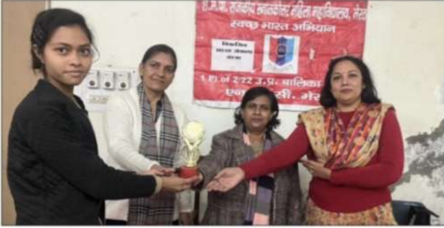
भाषण प्रतियोगिता की विजेता छात्रा को सम्मानित करते हुए।