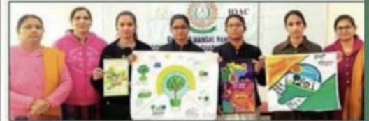
शहीद मंगल पांडेय में आयोजित पोस्टर प्रतियोगिता में मौजूद छात्राएं।