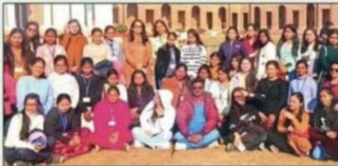
शैक्षिक भ्रमण में शामिल शहीद मंगल पाण्डेय कॉलेज की छात्राएँ।