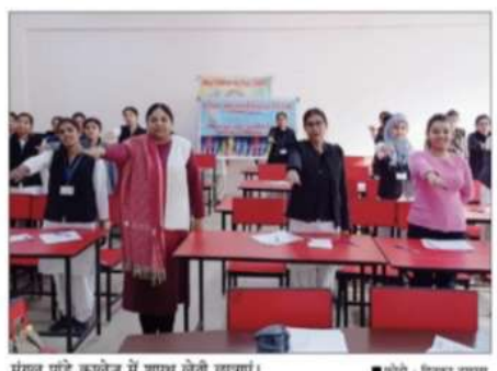
मंगल पांडे कॉलेज में शपथ लेती छात्राएं।