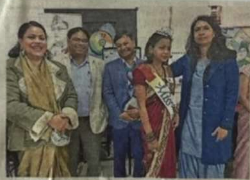
शहीद मंगल पांडे राजकीय स्नातकोत्तर महिला महाविद्यालय में स्टाफ के साथ छात्राएं