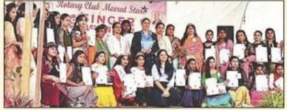
कार्यक्रम में मौजूद रोटरी क्लब की सदस्य।